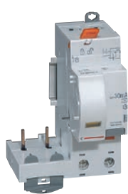
4 104 01

для автоматических выключателей DX 3 с шириной полюса 1 модуль