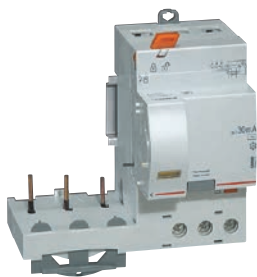
4 104 71