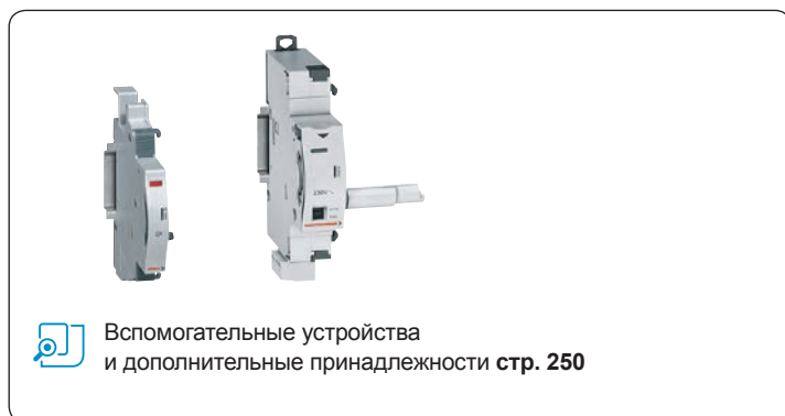
Вспомогательные устройства и дополнительные принадлежности стр. 250

Соответствуют требованиям стандарта МЭК 60898-1